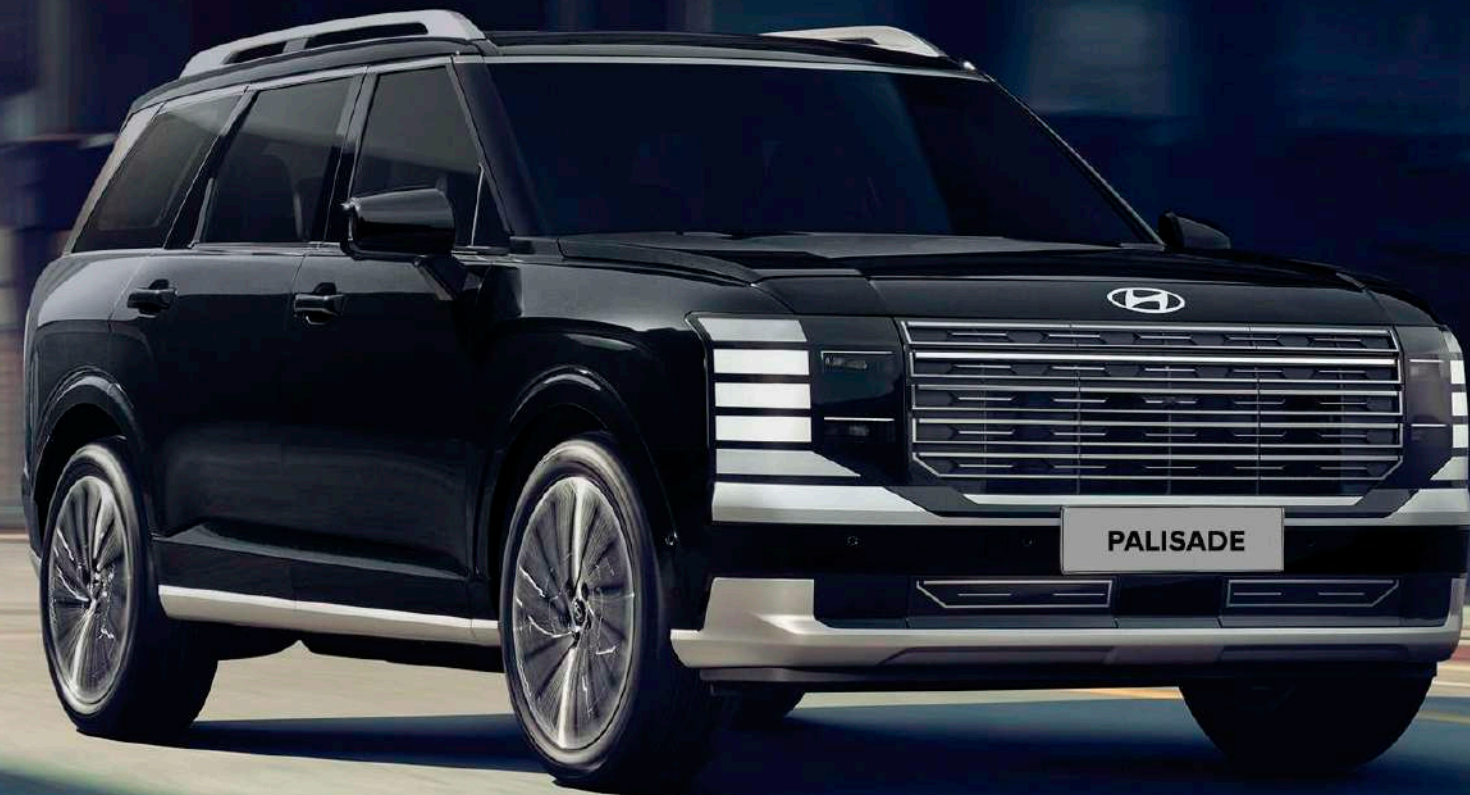
Color Premium Abyss Black Pearl

Con un diseño elegante, detalles atrevidos y proporciones llenas de dinamismo, The all-new PALISADE Hybrid proyecta seguridad en cada línea y consolida su esencia de lujo.