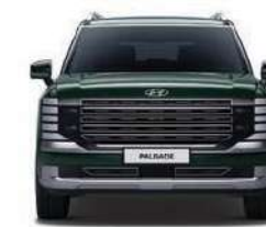
Parte Delantera 1,711

Las dimensiones indicadas corresponden a la versión Calligraphy con aros de 21". La altura total incluye el portaequipaje de techo. Unidad de medida: mm (milímetros)