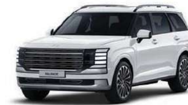
Creamy White Pearl