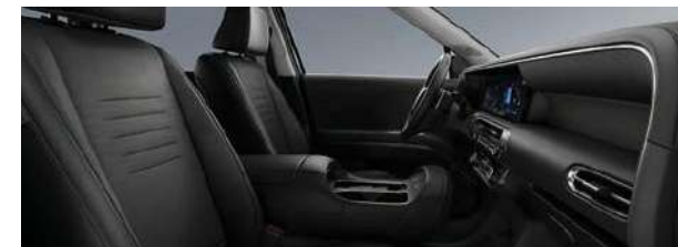
Asientos de Cuero

Las dimensiones indicadas corresponden a la versión Calligraphy con aros de 21". La altura total incluye el portaequipaje de techo. Unidad de medida: mm (milímetros)