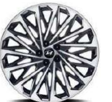
Aros de aleación de 21" (Exclusivos de la versión Calligraphy)

Exclusivo tapizado en cuero Nappa marrón, disponible solo en la versión Calligraphy.