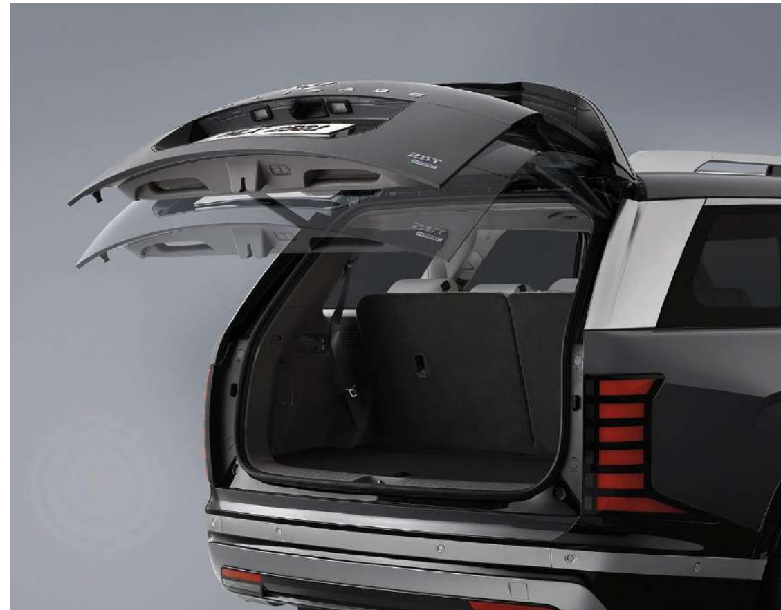
Maletera inteligente con apertura eléctrica.