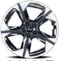
Aros de aleación de 20" (Limited HTRAC)