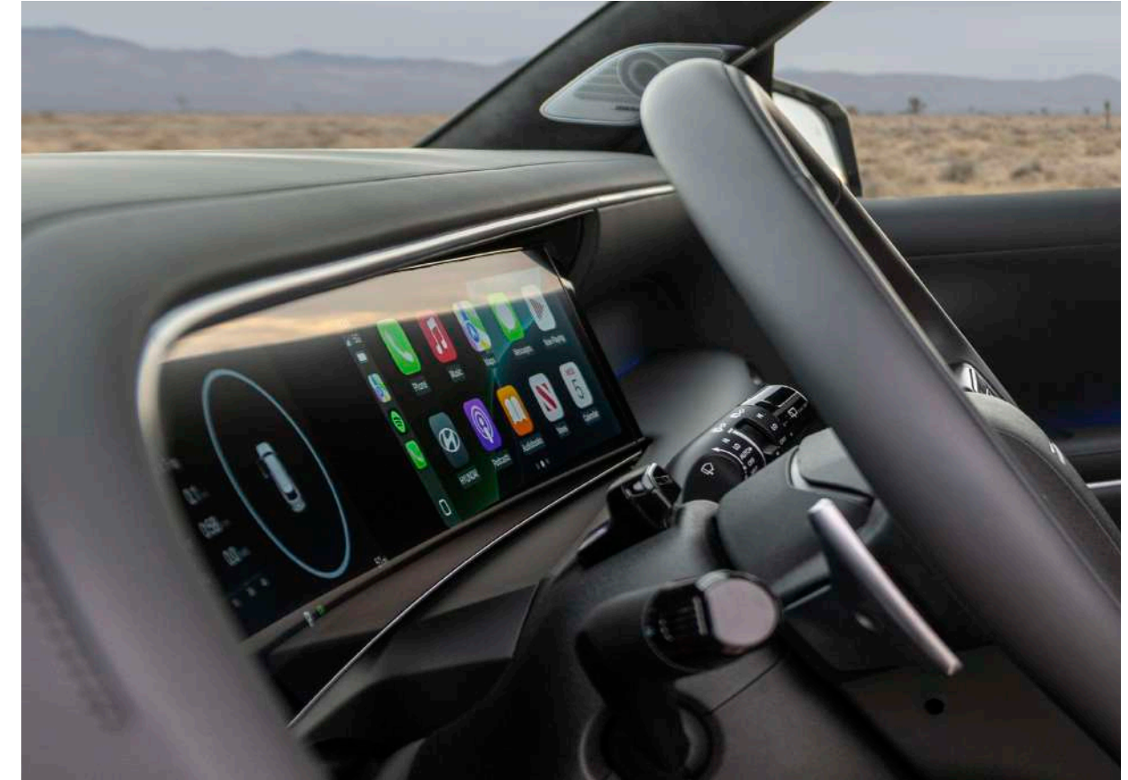
Sistema de infoentretenimientode 12.3" con radio AM/FM, entrada multimedia USB - C, Bluetooth® y conectividad para smartphones.