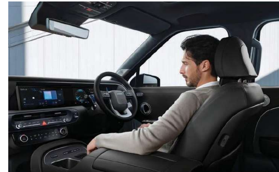
El Asiento Ergo-motion para el conductor go-motion Driver Seat

Cada característica está pensada para envolver a conductor y pasajeros en lujo absoluto. Asientos que relajan, tecnología innovadora y acceso personalizado: todo converge para brindar máximo confort y una experiencia premium en cada trayecto