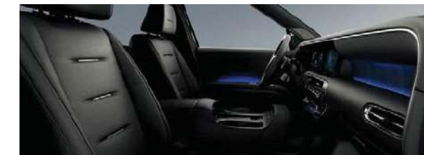
Asientos de Cuero Nappa

Elegante tapizado en cuero Nappa negro, exclusivo de la versión Calligraphy