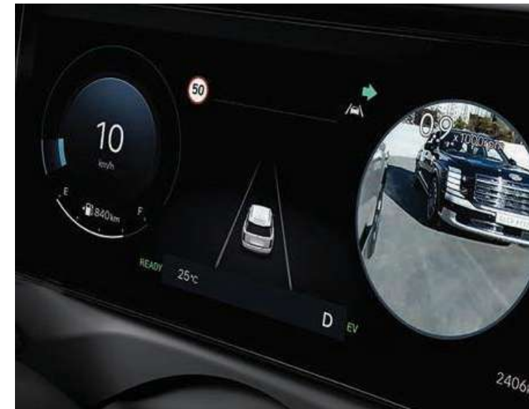
Blind-spot View Monitor: tecnología que amplía tu visión y eleva la seguridad en cada trayecto