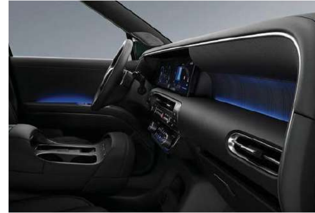
Iluminación ambiental interior / Palanca de cambios electrónica tipo columna (Shiftby Wire).