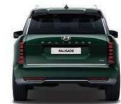
Parte Trasera 1,723