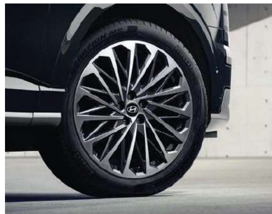
Luces traseras LED tipo combinación / Aros de aleación de 21 pulgadas.”