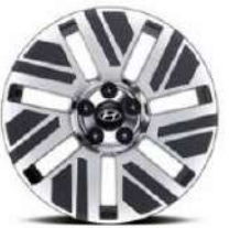
Aros de aleación de 18" (Premium 2WD)