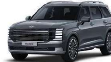
Ectronic Grey Pearl