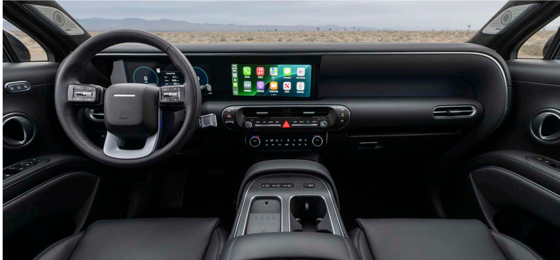
Pantalla panorámica curva.

The all-new PALISADE Hybrid deslumbra con un interior que fusiona elegancia, lujo y modernidad en perfecta armonía. Cada detalle está pensado para brindar una experiencia de manejo intuitiva y llena de precisión.