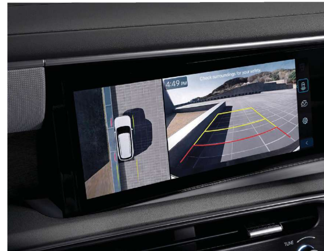
Cámara de visión 360° con guías de asistencia.