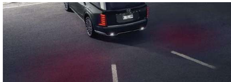
Sonido envolvente con el sistema de audio premium BOSE, cargador inalámbrico para mayor comodidad y luces guía de reversa que aportan seguridad en cada maniobra.