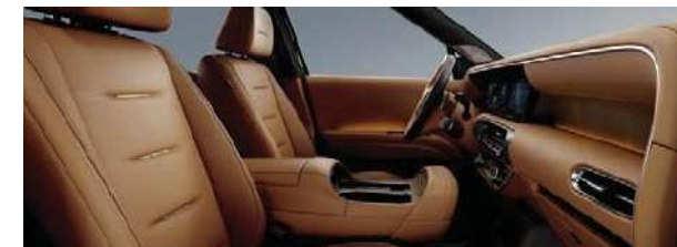
Asientos de Cuero Nappa

Exclusivo tapizado en cuero Nappa marrón, disponible solo en la versión Calligraphy.