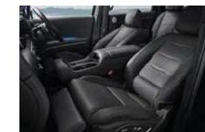
Modo Premium Relaxation en la primera fila