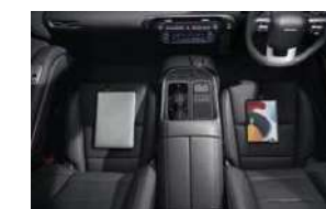
Puertos de carga USB-C de 100 W