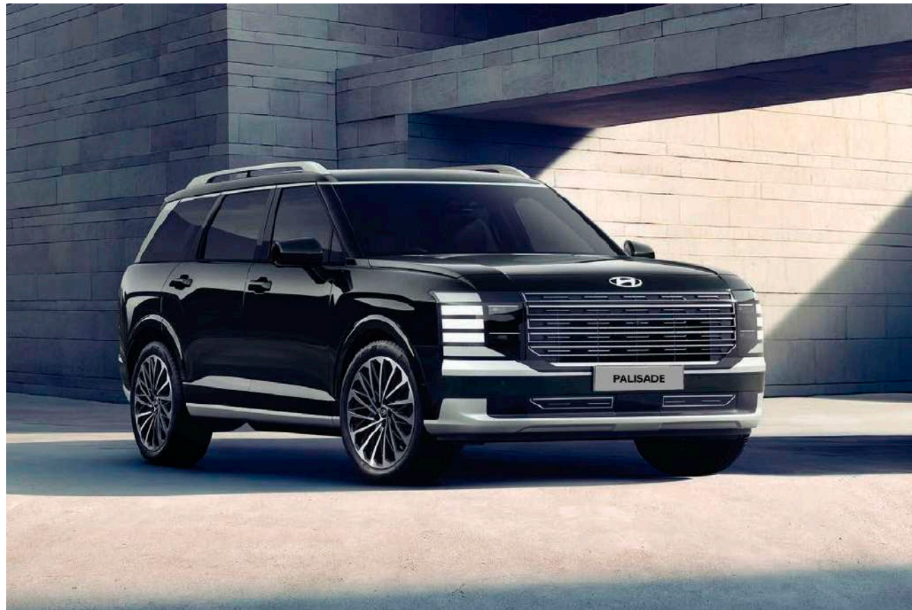
Faros tipo proyector que integran elegantes luces LED diurnas ocultas (DRL) y lámparas de posición, para un diseño moderno y distintivo.

Encanto que conquista desde el primer vistazo. The all-new PALISADE Hybrid deslumbra en cada ángulo, dejando una huella de elegancia y distinción.