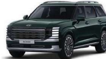
Robust Emerald Pearl (Solo Versión Calligraphy)