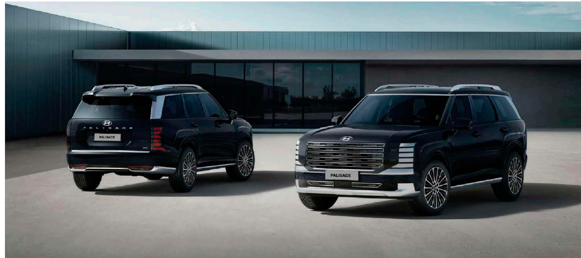
Spoiler trasero con luz de freno elevada LED, que aporta seguridad y un toque de estilo deportivo.