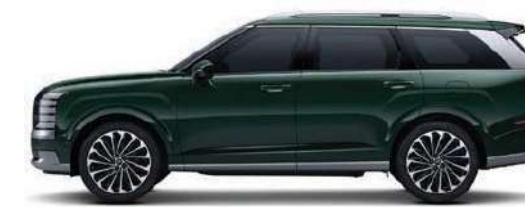
Distancia entre Ejes 2,970