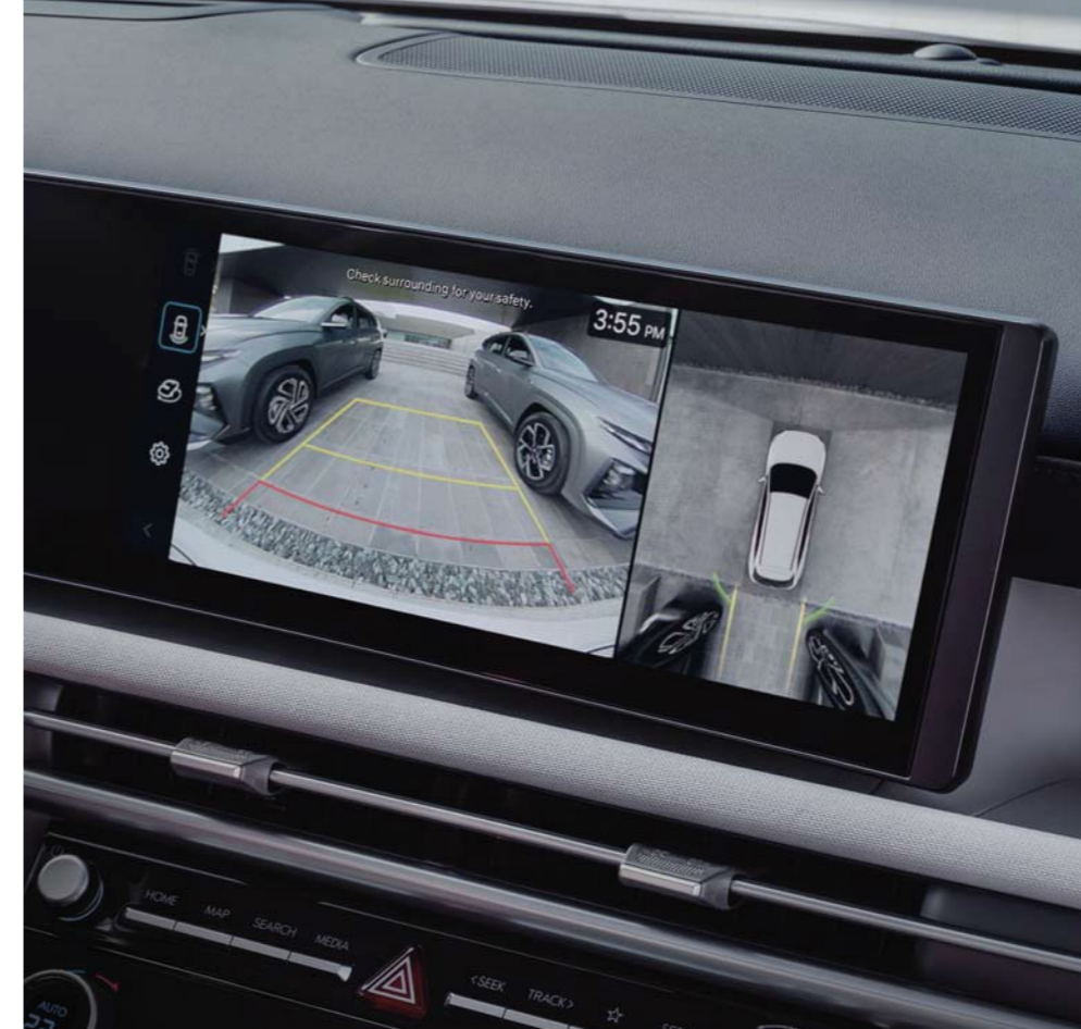
Monitor de vista periférica (SVM)