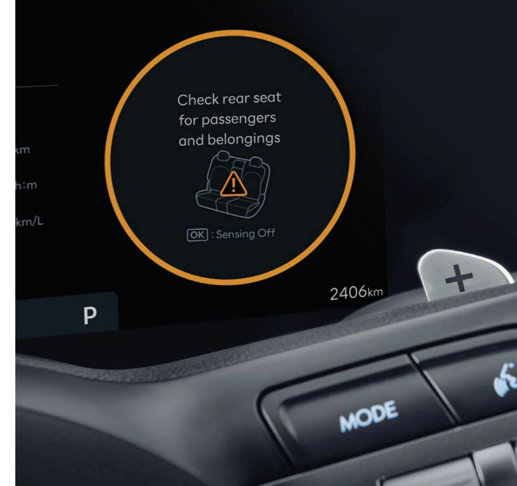
Alerta de ocupantes traseros (ROA)