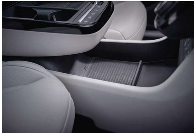
Luz de ambiente configurable / Multibandeja Consola tipo flotante