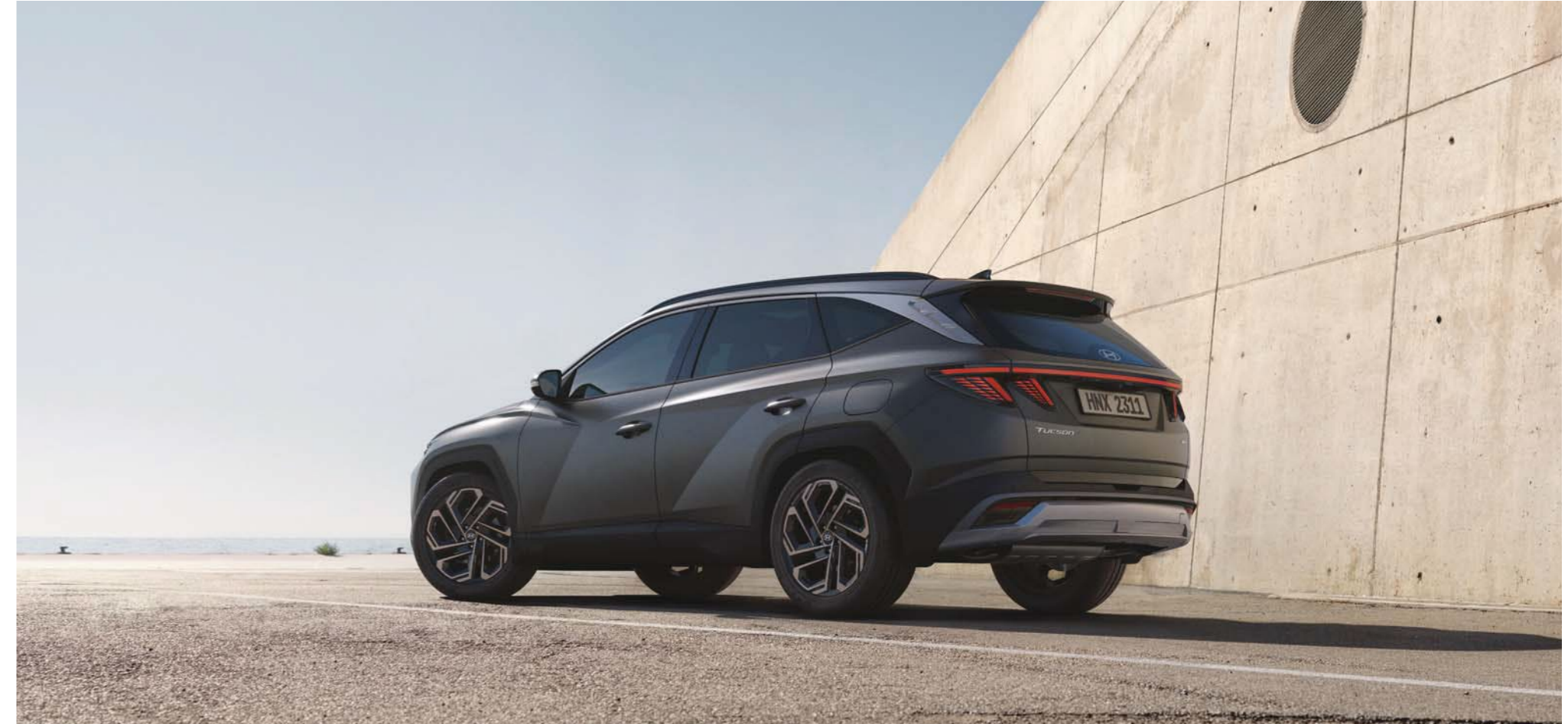
Luces traseras combinadas tipo LED / Parachoques trasero / Superficies en forma de joya paramétrica