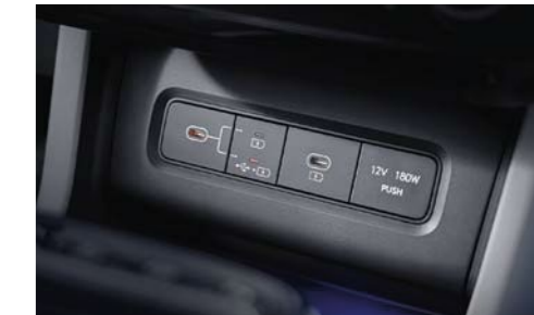
Puertos de datos/carga USB-C