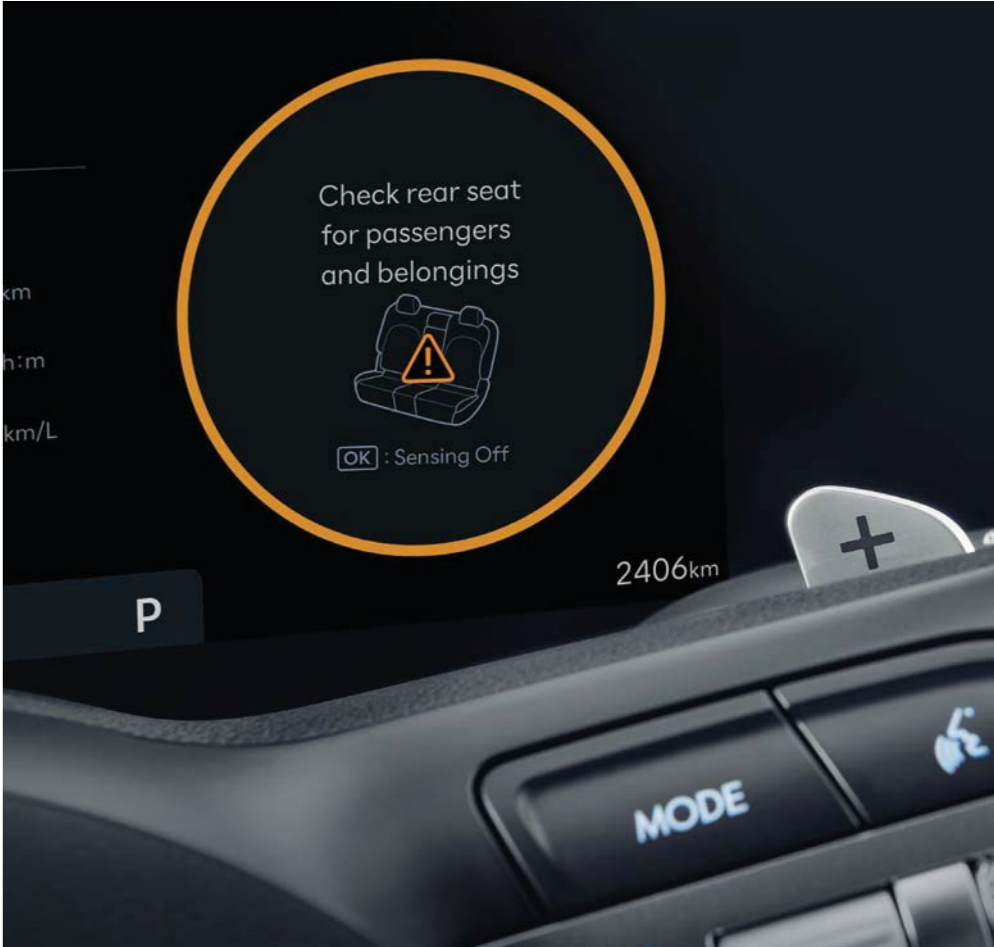
Alerta de ocupantes traseros (ROA)