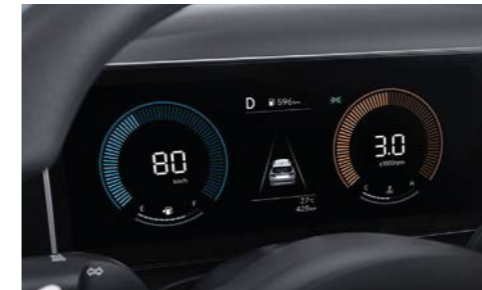
Tablero LCD en color de 4.2 pulgadas