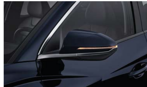
Intermitentes tipo LED integrados en los espejos retrovisores