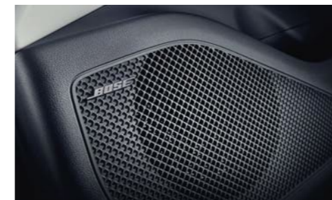
Sistema de sonido premium BOSE