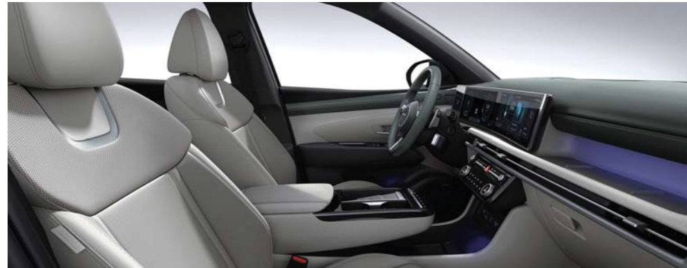
Cuero de tres tonos de verde