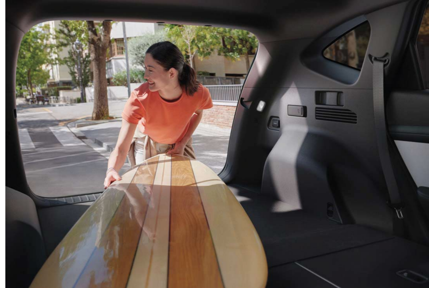
Asientos plegables / Sistema de plegado remoto