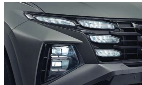
Faros tipo LED completos (Amplia proyección con Sistema Inteligente de Iluminación Frontal)