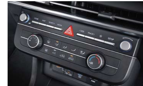
Aire acondicionado manual