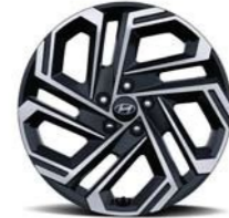
Llantas de aleación de 19" (Opcional)