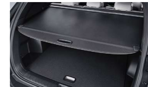
Cobertor de carga retráctil