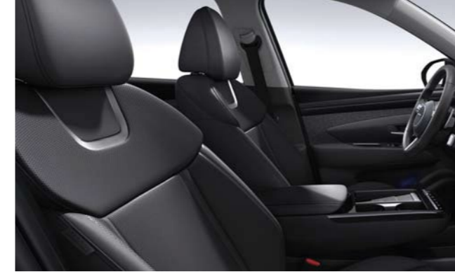
Cuero negro en un tono