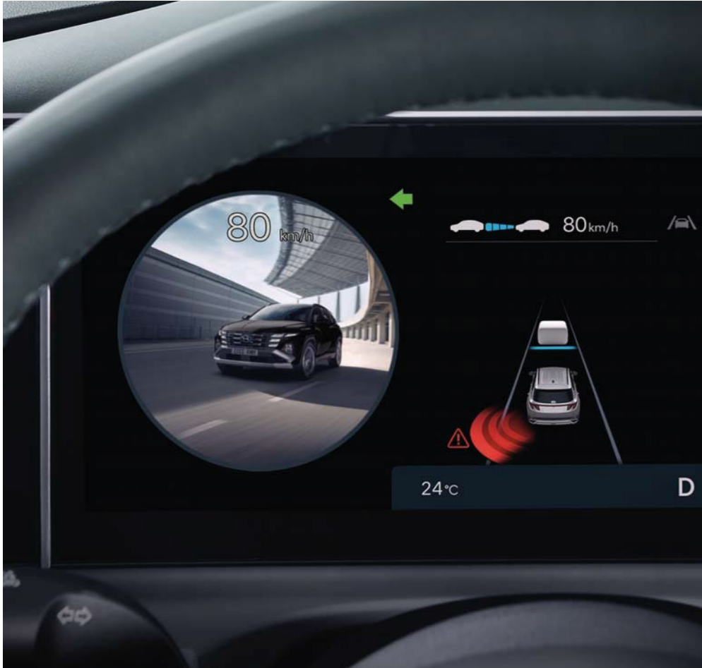
Asistente de puntos ciegos (BVM)

La new TUCSON está repleto de funcionalidades para protegerle de lo inesperado y asegurarle de que no se olvide de nadie.