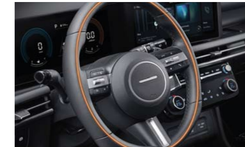
Volante con calefacción