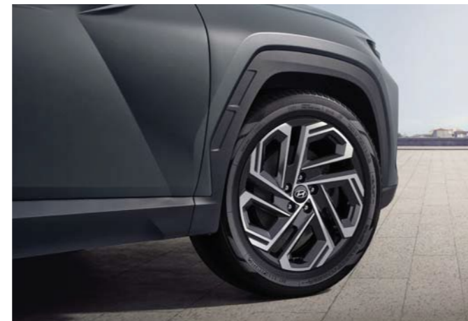
Barras de techo / Techo corredizo panorámico Llantas de aleación de 19 pulgadas