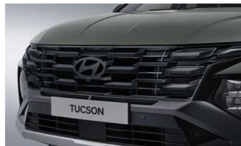
Parrilla del radiador cromada oscura (Luces de conducción diurna con Iluminación Oculta)