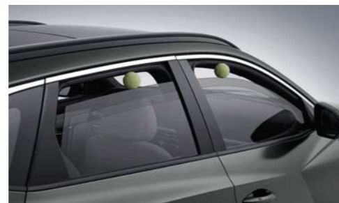
Ventanas eléctricas con función antipinzamiento