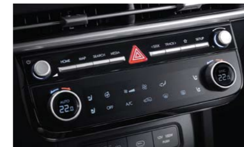
Sistema de aire acondicionado totalmente automático