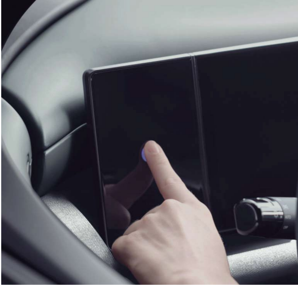
Autenticación por huella dactilar

Un diseño reinventado con tecnologías intuitivas que permiten una cómoda experiencia de manejo sin complicaciones.