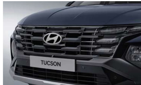
Parrilla del radiador con pintura metálica oscura luces de conducción diurna (Clear Type DRL)