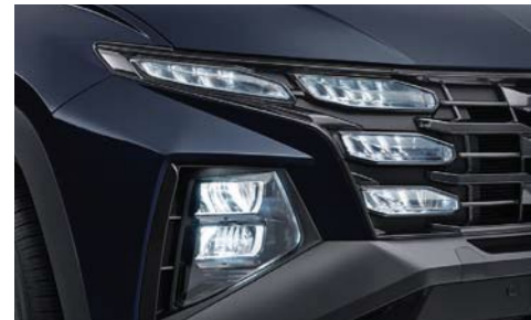
Faros delanteros tipo LED completos (Tipo MFR)