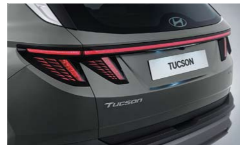
Luces traseras combinadas tipo LED