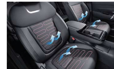
Asientos delanteros con calefacción y ventilación