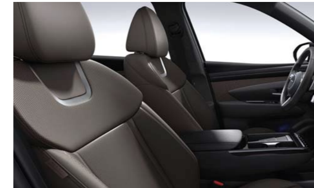
Cuero de color marrón