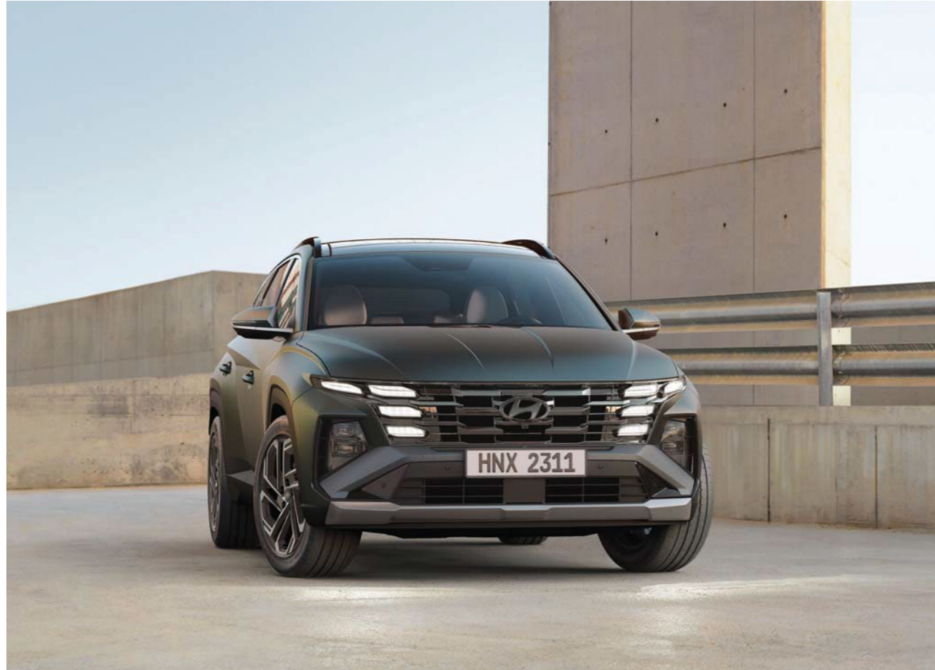
Faros de diseño ocultos en forma de joya paramétrica / Parrilla del radiador / Parachoques delantero

Salga de lo común con elementos atractivos, como en los faros delanteros en forma de joya y en las laterales, actualizados audazmente para permitirle destacarse en la multitud.