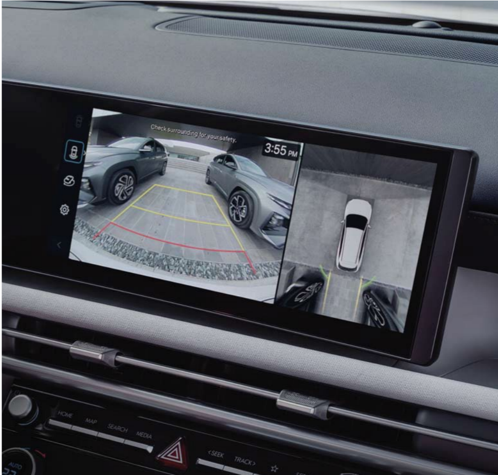
Monitor de vista periférica (SVM)