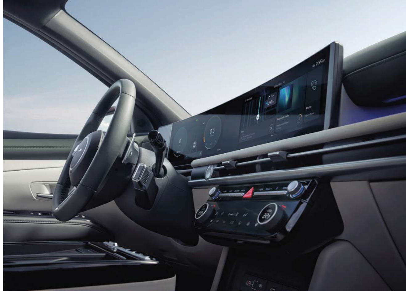
Pantalla curva panorámica de 12.3 pulgadas (Tablero) + 12.3 pulgadas (AVNT)