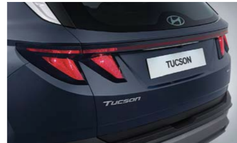
Luces traseras combinadas tipo halógenas