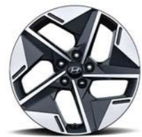
Llantas de aleación de 18" (Opcional)