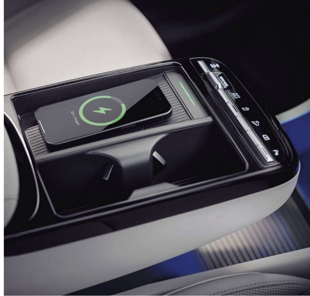
Cargador Inalámbrico (WPC)