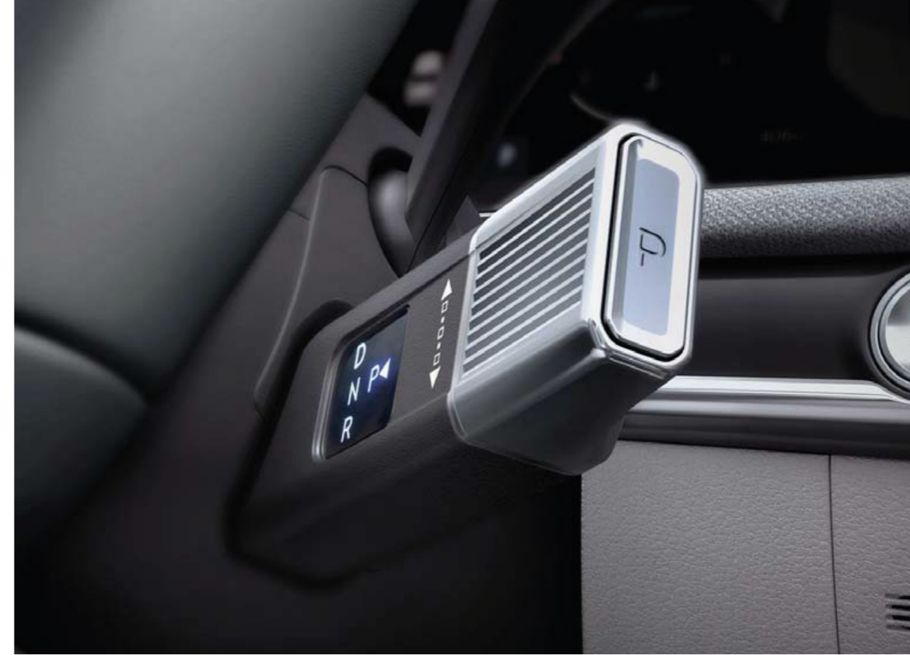
Cambio electrónico tipo columna (SBW)