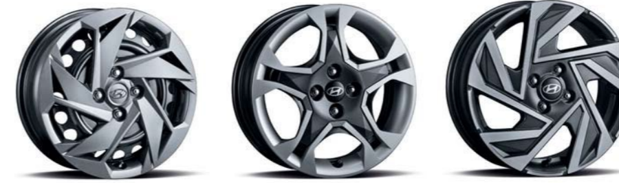
Llanta de acero de 15" con cubierta de tamaño completo