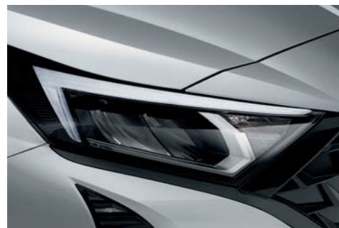
Luces para circulación diurna (DRL)