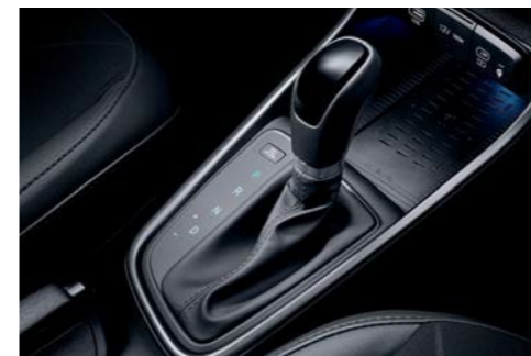
DCT de 7 velocidades