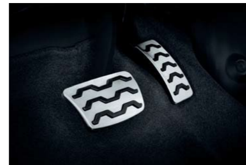
Pedales de aluminio