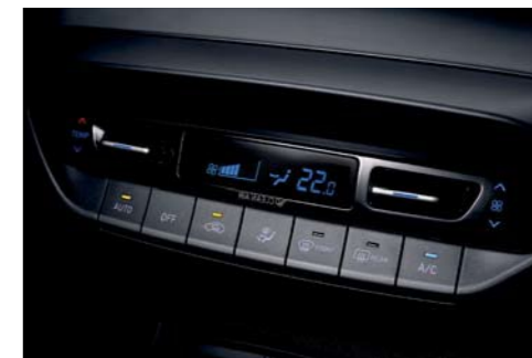
Control automático de acondicionamiento de aire