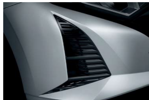
Paragolpes delantero aerodinámico