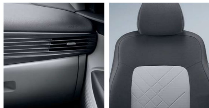
Interiores bitono negro y gris (tapizado integral)