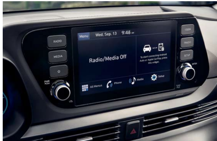
Tablero de supervisión Pantalla táctil AVN de 8 pulgadas