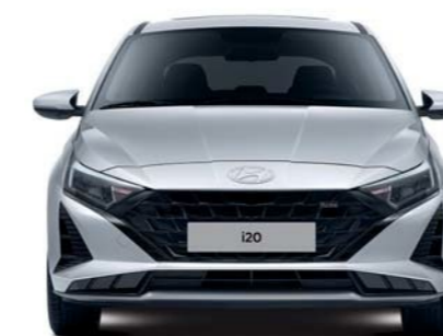
Ancho general 1,775