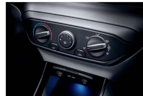
Aire acondicionado manual