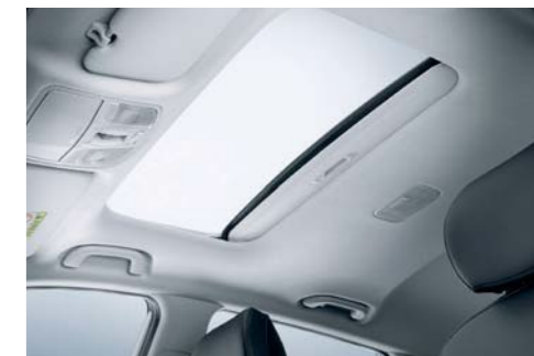
Techo corredizo eléctrico