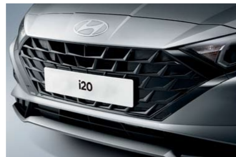
Parrilla paramétrica con diseño en forma de joya