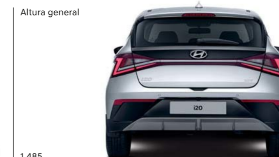
Altura general 1,485 Ancho general 1,775