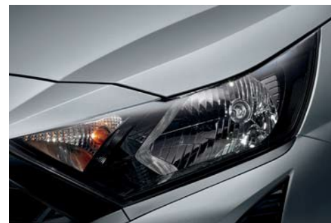
Lámparas halógenas (2MFR)