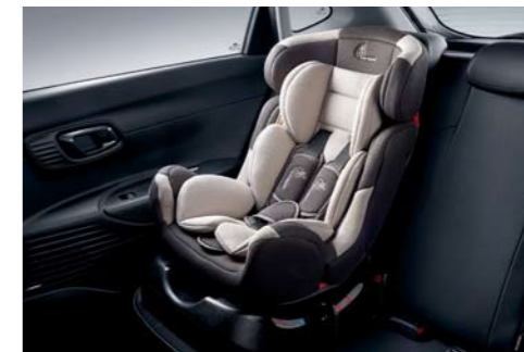
Sistema de anclaje para asientos infantiles