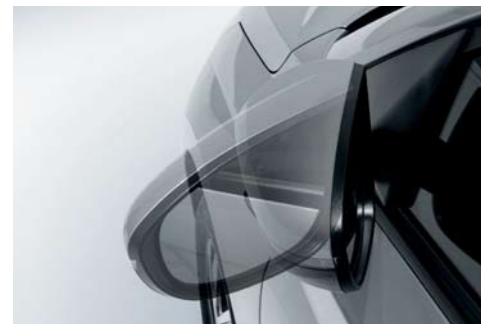
Espejos eléctricos plegables