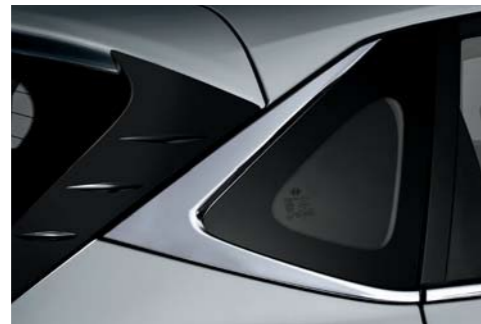
Molduras de borde cromadas