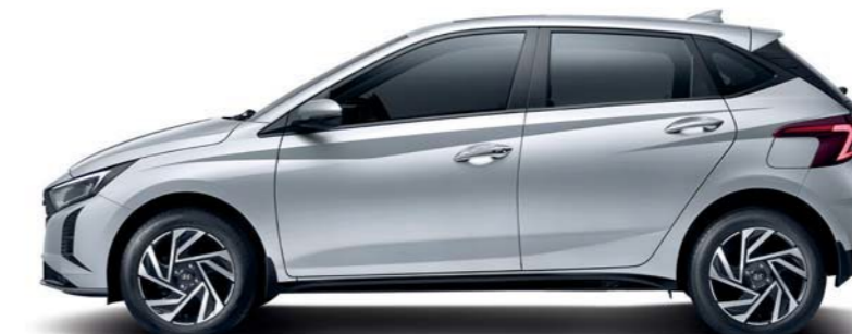
Distancia entre ejes 2,580 Longitud general 3,995