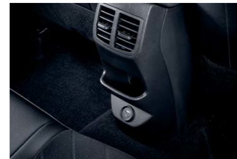
Rejilla de ventilación en la 2ª fila / carga USB