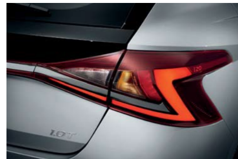
Luces combinadas traseras