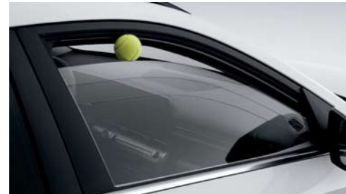
Alza vidrios eléctricos con función auto up/down & safety