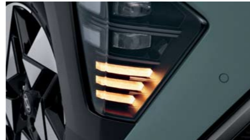
Intermitentes LED (delanteros/posteriores)