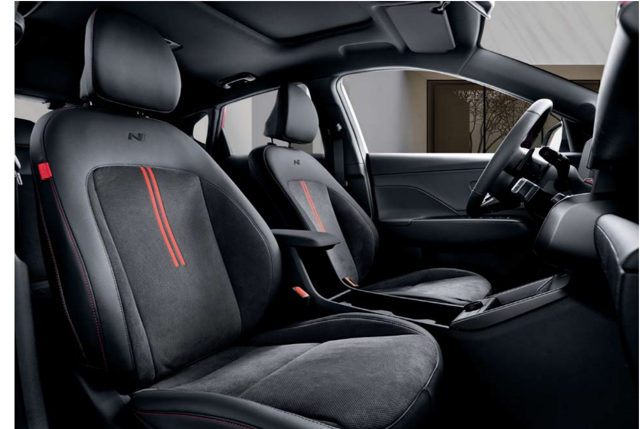
Asientos auténticos combinados de cuero y alcántara exclusivos de la línea N