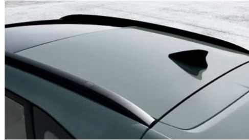
Rieles de techo