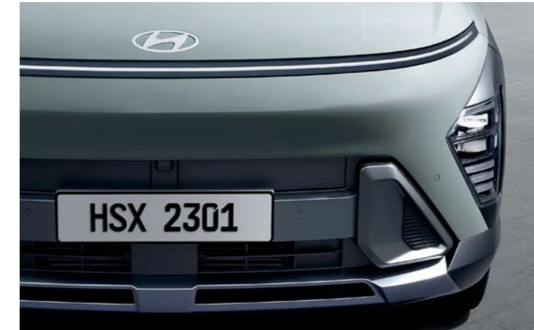
Luz DRL horizontal