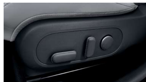
Asiento del conductor eléctrico