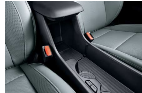
Consola abierta de almacenamiento en consola abierta