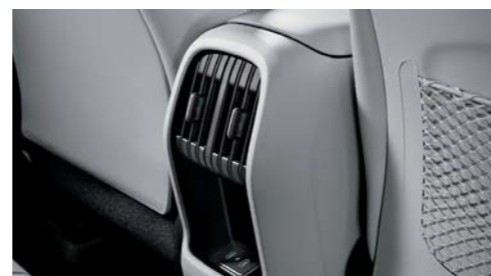
Rejilla de ventilación posterior