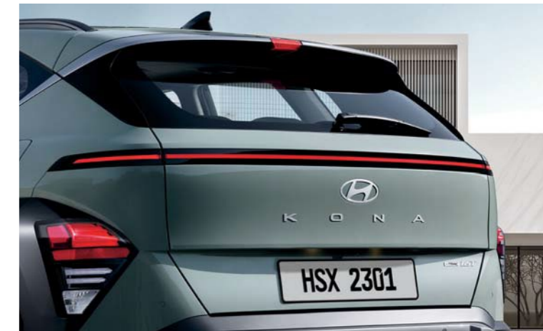
Sistema integrado de iluminación LED