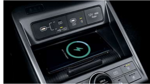
Puertos de carga USB-C / Cargador inalámbrico