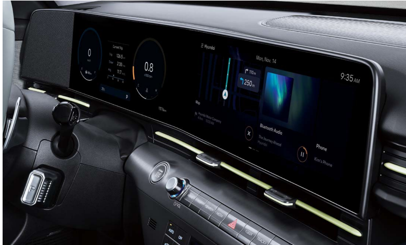
Pantalla panorámica de 12.3 pulgadas

La pantalla panorámica integrada de 12,3 pulgadas y la avanzada tecnología de asistencia al conductor ofrecen un confort de alta tecnología y aumentan la satisfacción del usuario en el uso diario.