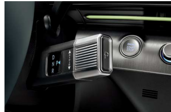
Selector de cambios (SBW)