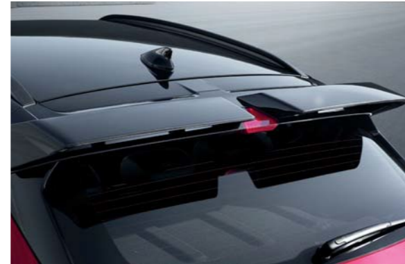
Spoiler posterior tipo ala exclusivo de la línea N