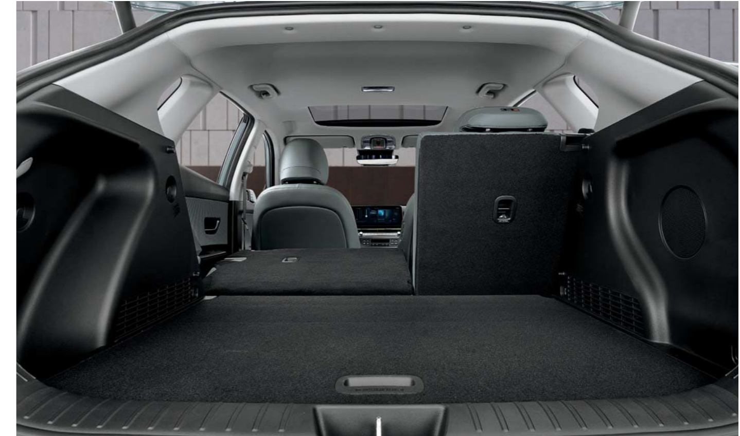
2º fila de asientos abatibles 6:4