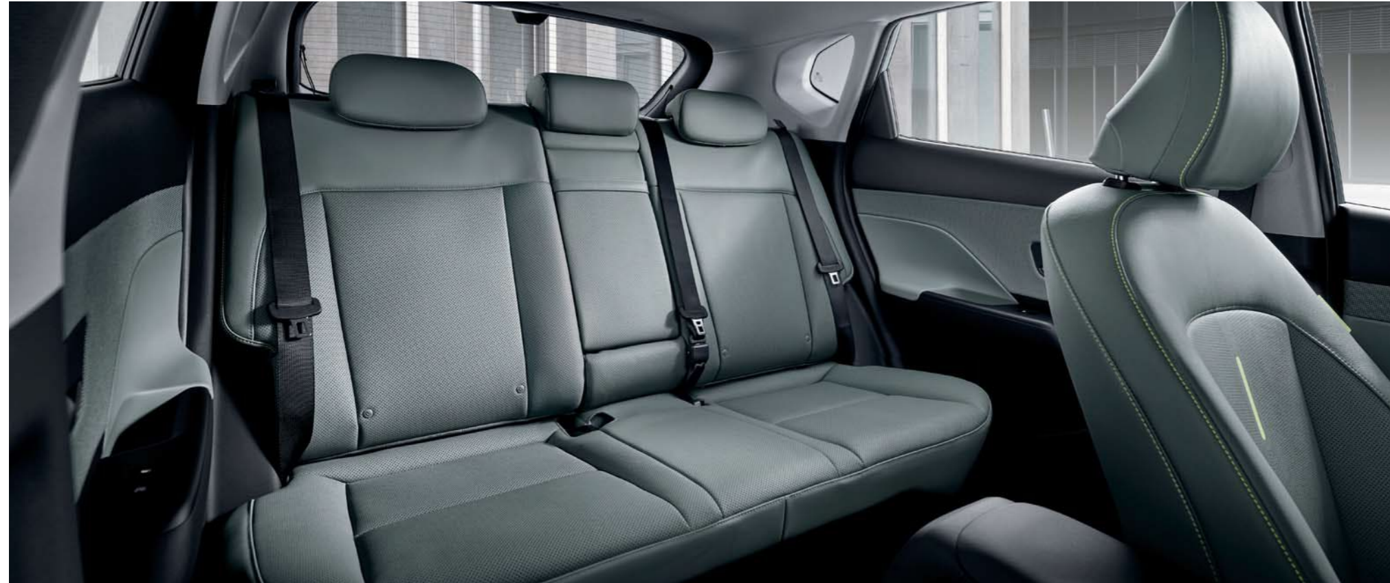
Espacio en 2º fila

El interior de la new KONA es práctico y espacioso, con especial atención a la comodidad de los pasajeros traseros y un amplio espacio para el equipaje, que se adapta a diferentes estilos de vida.