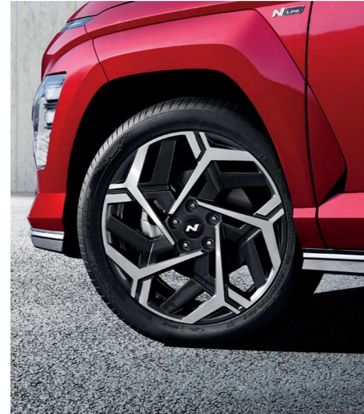
Aros de aleación de 19 pulgadas / Revestimiento del color de la carrocería, exclusivo de la línea N