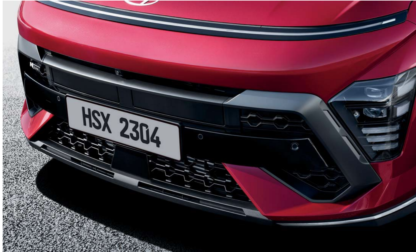
Parachoques delantero y faldón de los parachoques exclusivos de la línea N

La versión N Line irradia audacia y dinamismo, con un diseño exterior de altas prestaciones, inspirado en el célebre N de altas prestaciones.