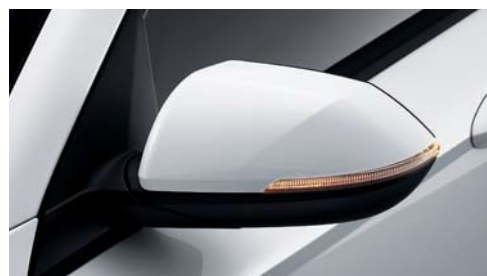
Retrovisor exterior (Calefactado / Plegable / Intermitente LED)