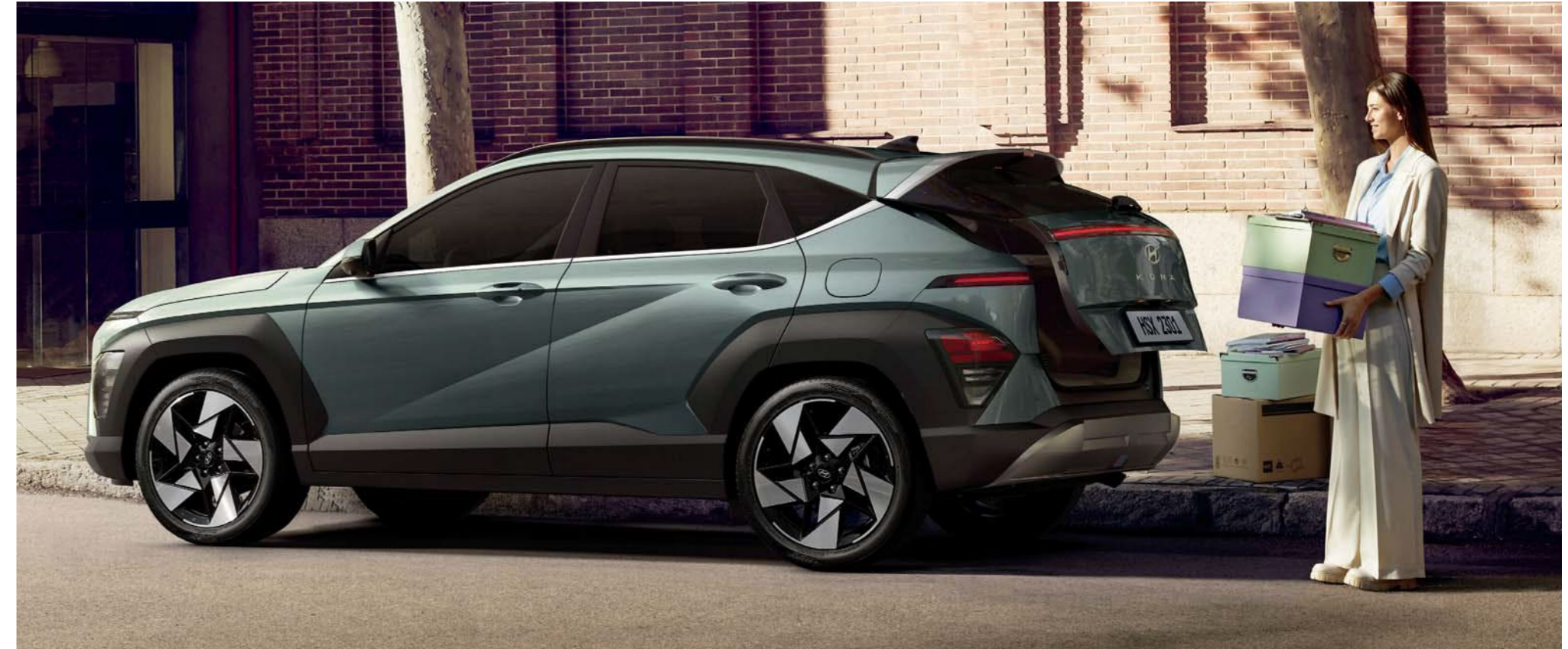
Maletera eléctrica inteligente - Apertura automática y altura ajustable