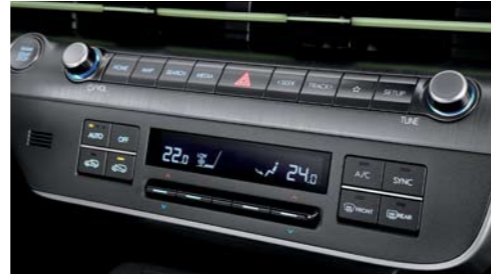
Sistema de aire acondicionado automático