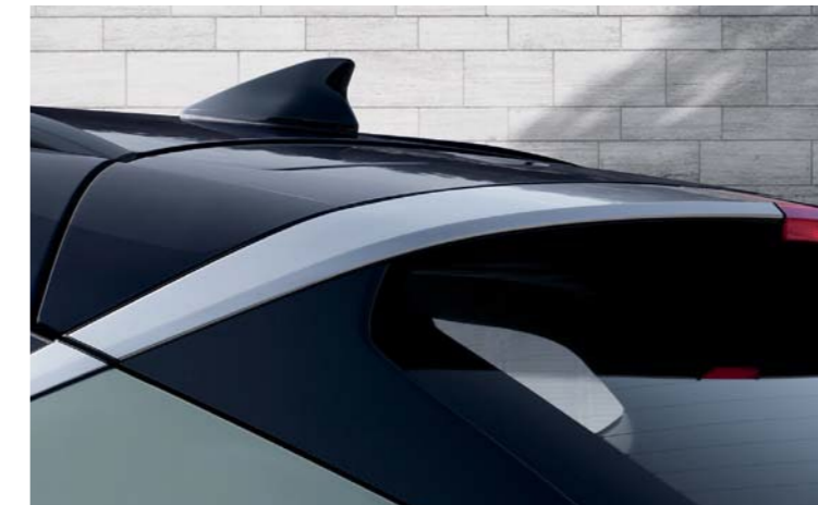
Línea cromada de conexión afilada