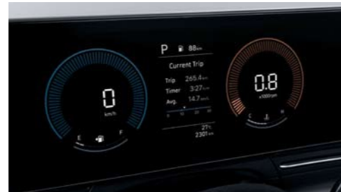
Panel de instrumentos (LCD en color de 4 pulgadas)