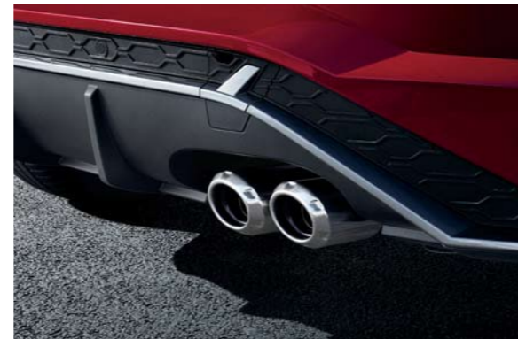
Tubo de escape de doble punta exclusivo de la línea N