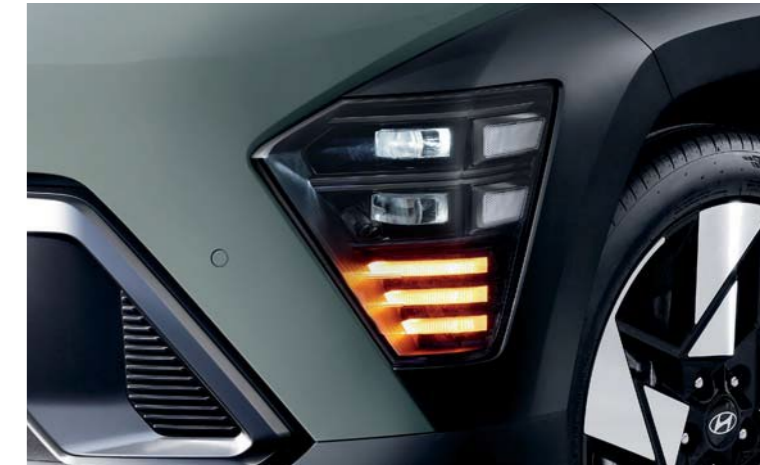
Luces LED con amplia proyección