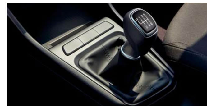
Transmisión manual de 6 velocidades (MT)

Cámbielo de marcha a su gusto: Los motores de gasolina del Accent vienen con una selección de cajas de cambios para adaptarse a su estilo de manejo: La transmisión variable inteligente (IVT) que utiliza datos en tiempo real para ajustar los puntos de cambio o la manual de 6 velocidades que también se ofrece como equipamiento de serie con el diesel. También hay una caja automática de 6 velocidades disponible con el diesel.