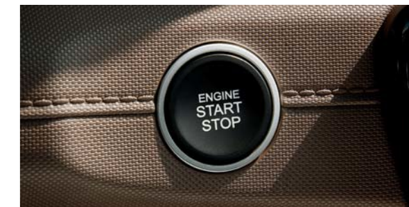
Llave inteligente con botón de arranque