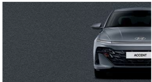
Gris Titán Metálico_R4G