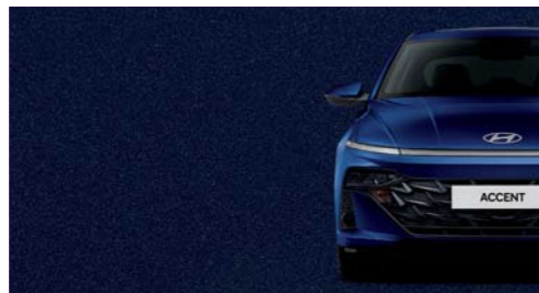
Azul Trueno Metálico_NB5