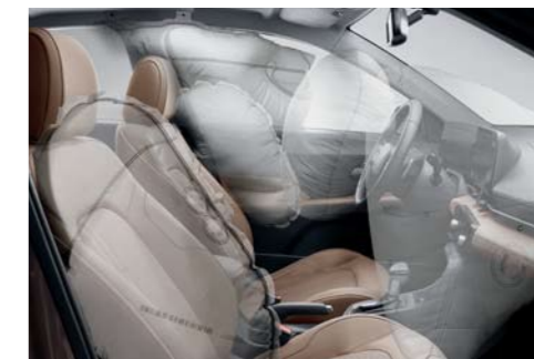
Sistema de 6 airbags