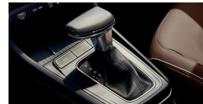
Transmisión variable inteligente (IVT)

A diferencia de las CVT tradicionales, la IVT utiliza una correa de cadena para gestionar un par más elevado. La tecnología de control de cambio adaptativo utiliza datos en tiempo real para ajustar los puntos de cambio de la transmisión.