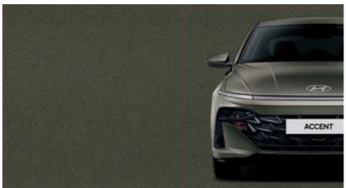
Marrón Telúrico Perlado_TBP