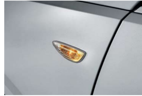
Intermitente de guardabarros (tipo bombilla, STD)