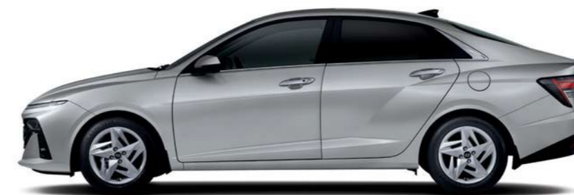
Distancia entre ejes Longitud general