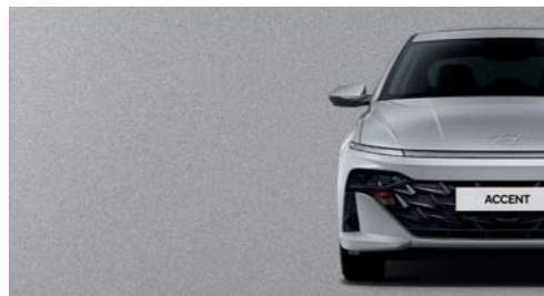
Plata Tifón Metálica_T2X