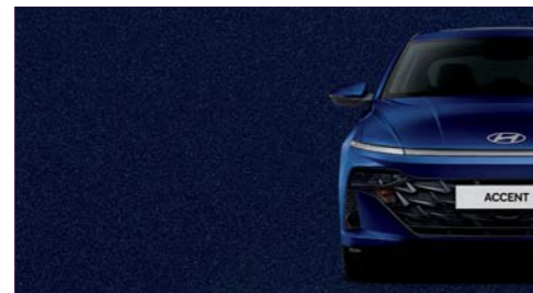
Azul Trueno Metálico_NB5