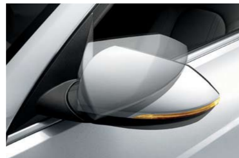
Intermitentes LED (OPT)