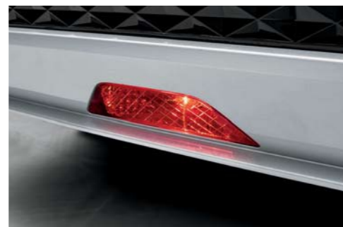
Luz antiniebla trasera