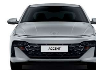
Ancho general 1,765