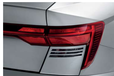
Luces combinadas traseras (tipo bombilla)