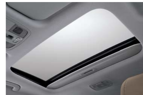
Techo corredizo eléctrico