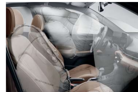
Sistema de 6 airbags