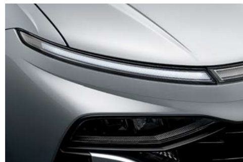
Luces para circulación diurna LED