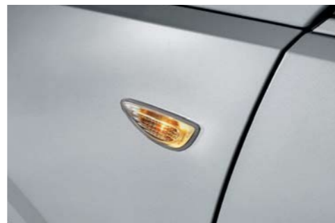
Intermitente de guardabarros (tipo bombilla, STD)