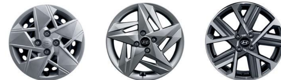
Cubierta de llantas de acero de 15"