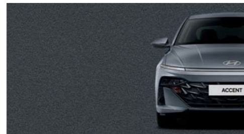
Gris Titán Metálico_R4G