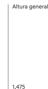
Altura general 1,475 Ancho general 1,765