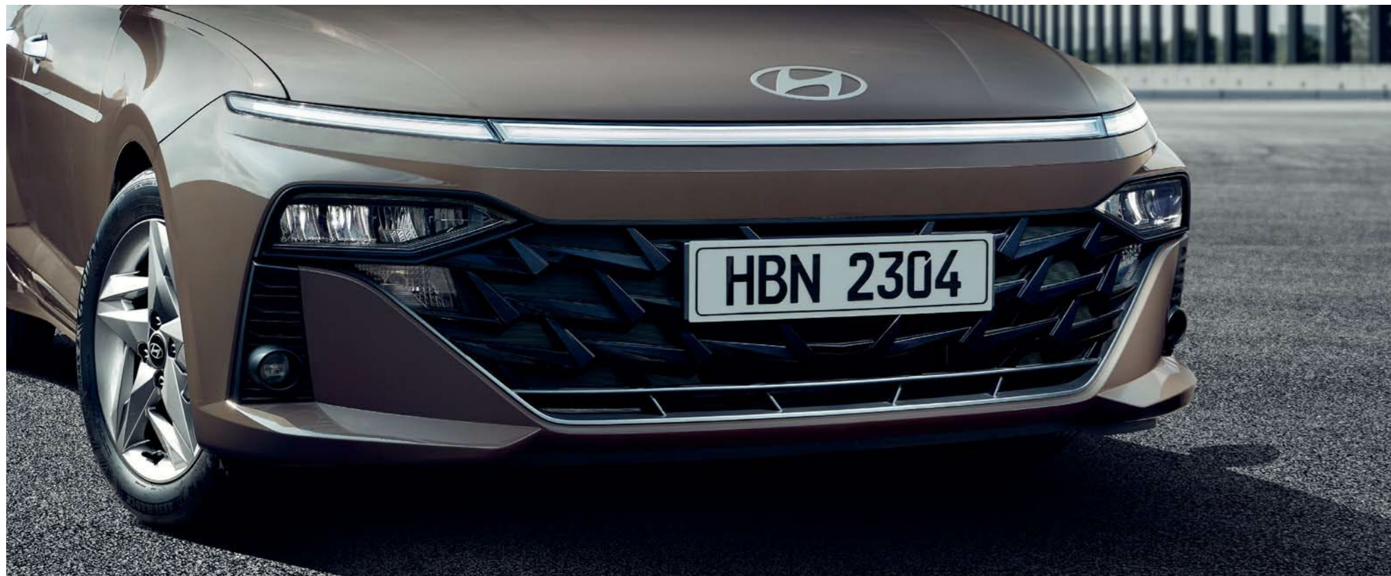
Luz LED horizontal/Faros LED (Multi MFR) / Parrilla paramétrica cromada negra

En un mundo de modelos parecidos, el nuevo Accent destaca por su distintiva luz de horizonte: una exclusiva insignia luminosa que lo distingue en la carretera. La parrilla paramétrica cromada en negro y las llamativas llantas de aleación añaden los perfectos toques finales.