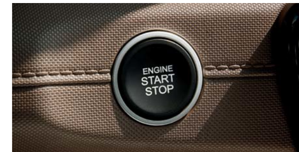
Llave inteligente con botón de arranque