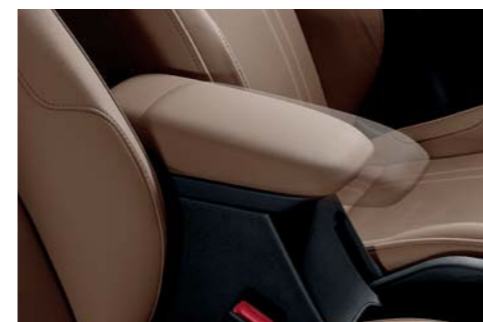
Caja de consola deslizable