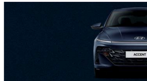
Azul Medianoche Perlado_UB7