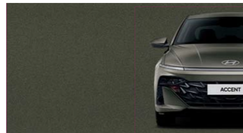
Marrón Telúrico Perlado_TBP