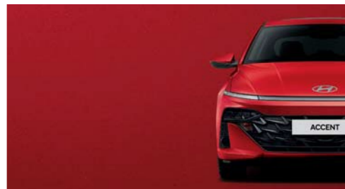
Rojo Ardiente Perlado_R4R