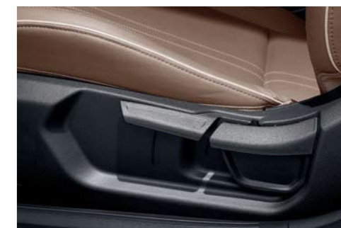
Regulador de altura del asiento del conductor

* Las características y especificaciones pueden variar según el mercado. Consulte al distribuidor local.