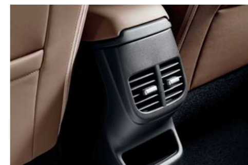
Ventilación en la parte trasera