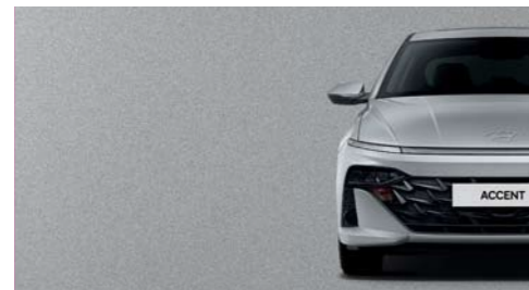
Plata Tifón Metálica_T2X