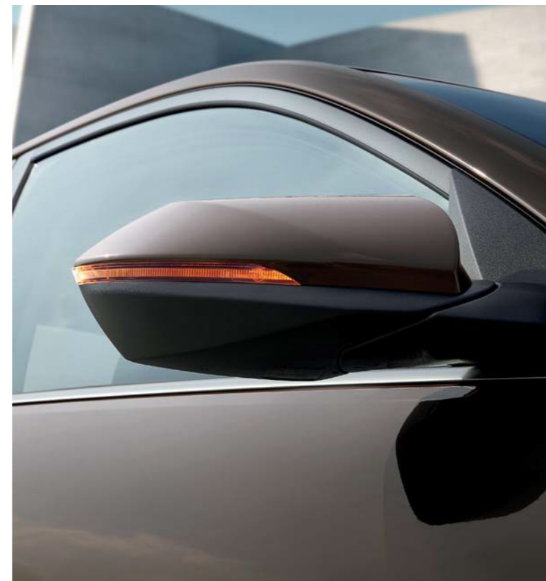
Espejos retrovisores exteriores e intermitentes