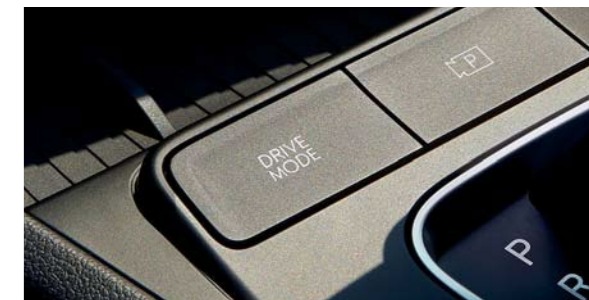
Selección del modo de manejo

Elija entre el modo Deportivo para un mayor rendimiento, el modo Eco para un óptimo ahorro de combustible o el modo Normal, el equilibrio perfecto entre rendimiento y eficiencia.