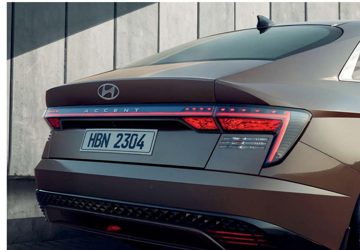
Luces LED traseras combinadas