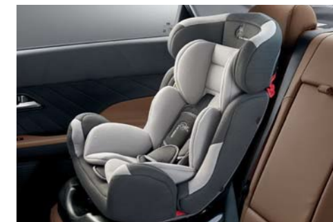
Sistema de anclaje para asientos infantiles