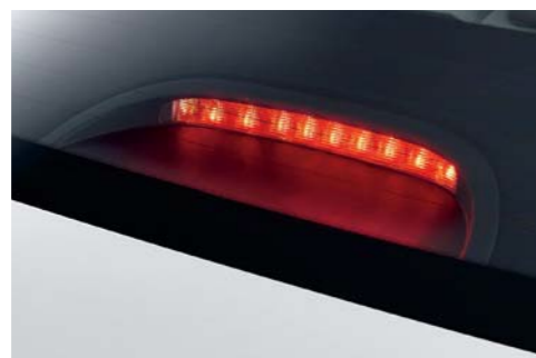
Faro de freno alto