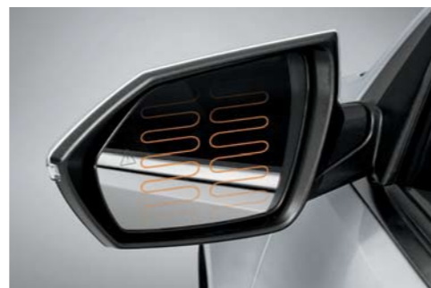
Espejos laterales con calefacción