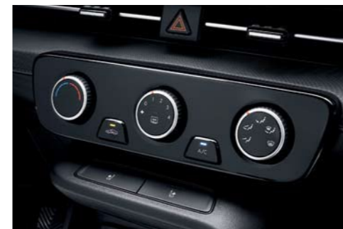
Sistema de aire acondicionado manual