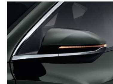
Espejos retrovisores externos con LED