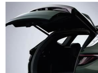
Sistema de maletero inteligente