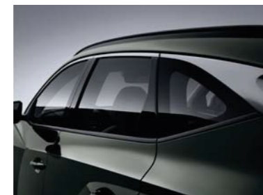
Molduras de borde cromadas