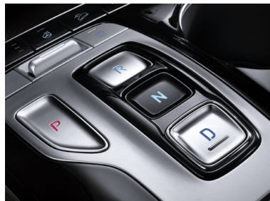
Transmisión automática electrónica