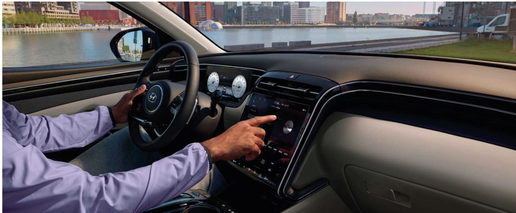
Tablero central totalmente táctil (perfiles personalizados)