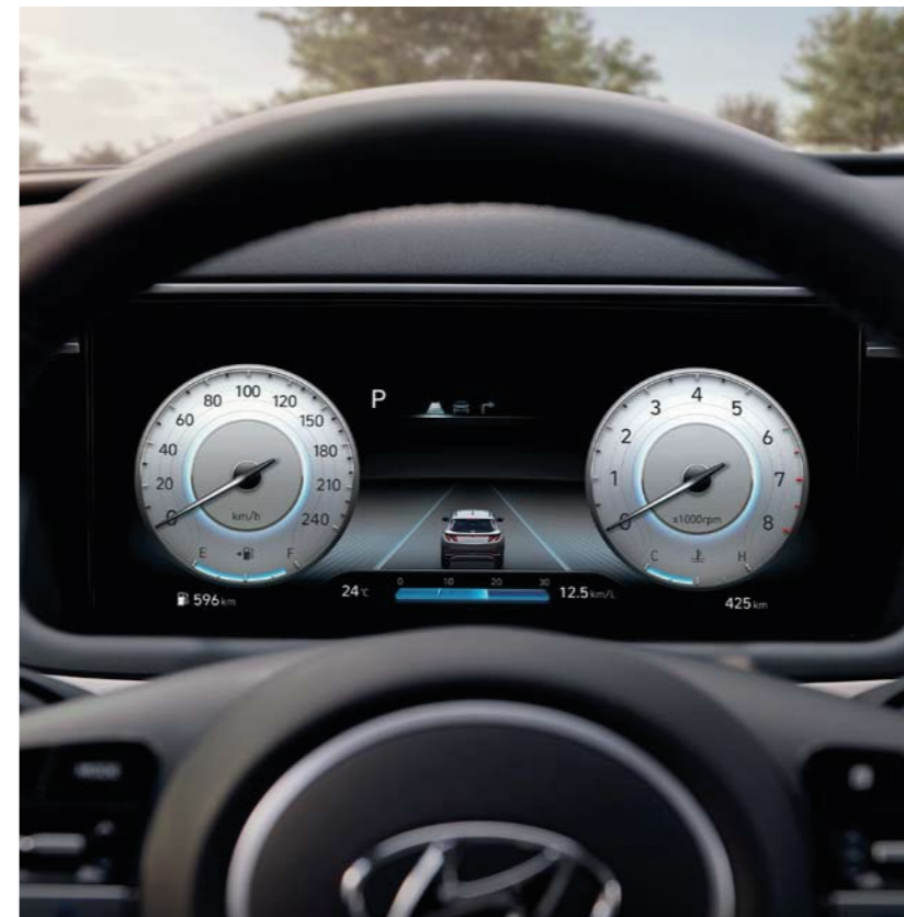
Tablero abierto de 10.25"