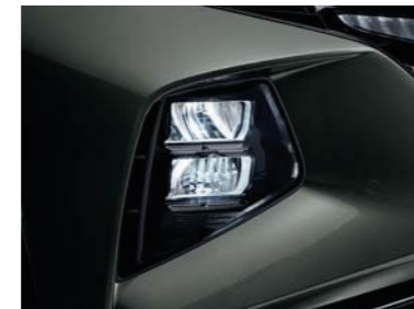
Faros LED completos tipo MFR