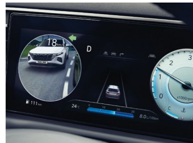
Monitor y alerta de punto ciego