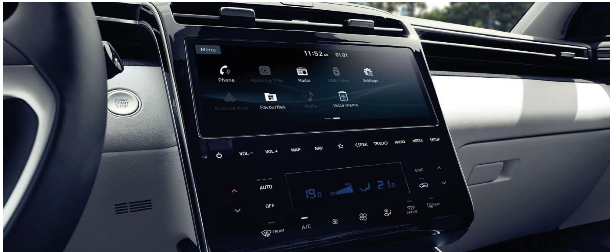
Pantalla táctil LCD de 10.25"