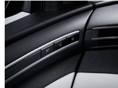
Sistema de memoria integrado (IMS)