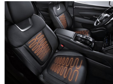
Asientos delanteros con calefacción