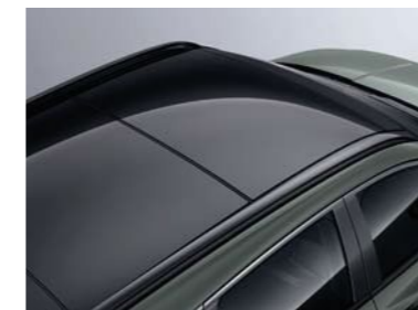
Techo corredizo panorámico