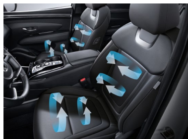
Asientos delanteros ventilados