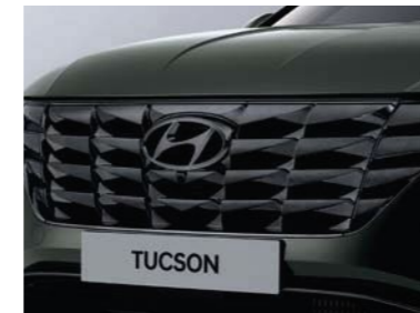
Parilla de radiador cromada negro oscuro