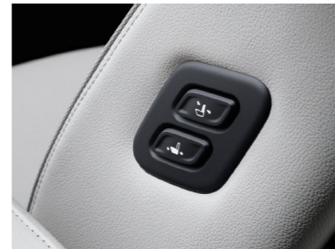
Dispositivo de paso