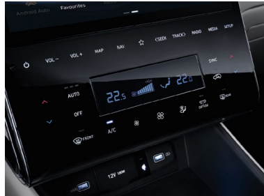
Sistema de aire acondicionado totalmente automático