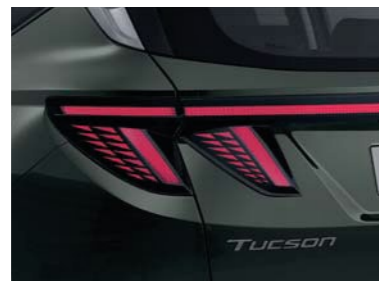
Luces LED traseras combinadas