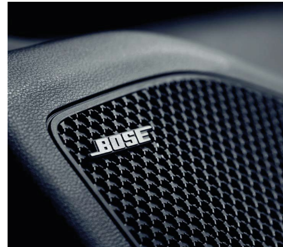
Audio Bose de primera calidad