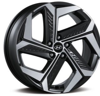
Llanta de aleación de 19"